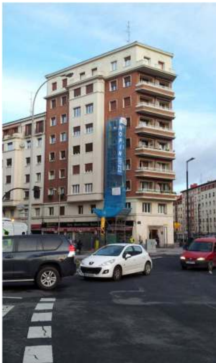
REHABILITACION DE VIVIENDA EN VITORIA-GASTEIZ