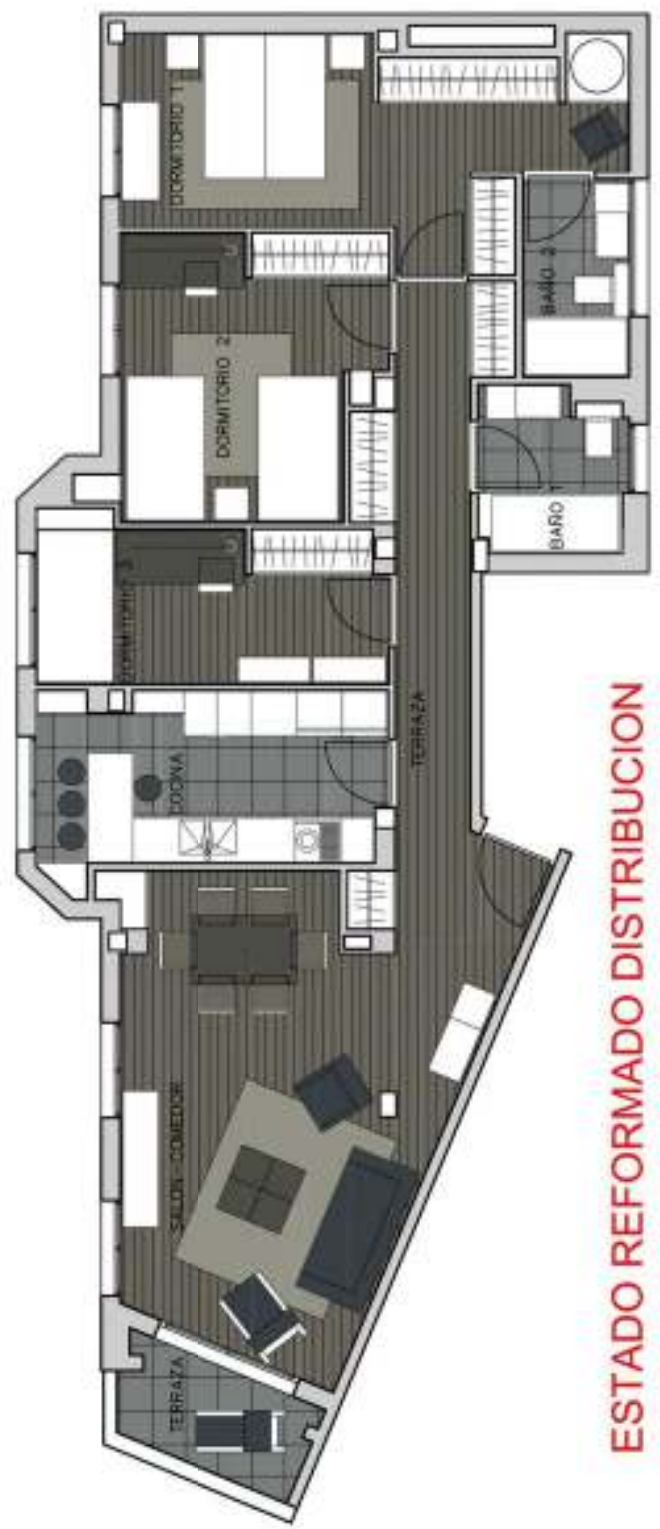
ESTADO REFORMADO DISTRIBUCION